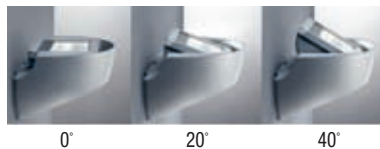
Logement optique réglable sur 3 positions

Stanpro est axé sur la qualité. Pour les détails complet des garanties, voir nos termes et conditions.