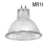
MR16 20, 35, 50W / IR= 35, 50W Écran de verre requis. Douille GU 5.3 (Halogène)