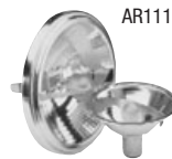
AR111 35, 50W / IR= 35, 50W Borne à vis (Halogène)

Les lampes offrant une distribution à faisceau large standard sont incluses. Pour les informations sur les lampes spécialisées, vous reporter à notre section «Le monde nous offre de merveilleuses couleurs».