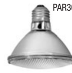
PAR30 50, 75W / IR= 45, 55W Douille à base moyenne (Halogène)