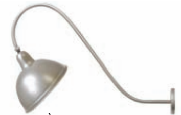
À moins de 18" de l'enseigne