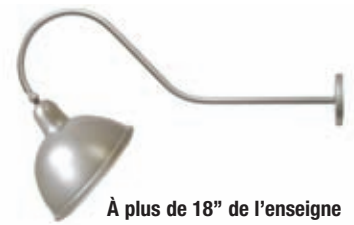
À plus de 18" de l'enseigne