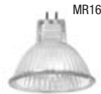
MR16 20, 35, 50W / IR= 35, 50W Écran de verre requis. Base Gu 5.3 (Halogène)

Les lampes offrant une distribution à faisceau large standard sont incluses. Pour les informations sur les lampes spécialisées, vous reporter à notre section «Le monde nous offre de merveilleuses couleurs».